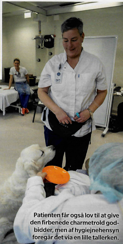
Patienten får også lov til at give den firbenede charmetrold godbidder, men af hygiejnensyn foregår det via en lille tallerken.