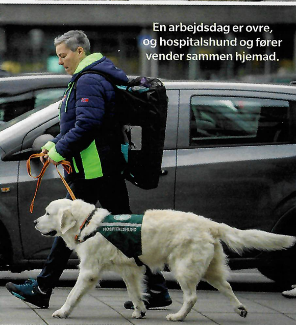
En arbejdsdag er ovre, og hospitalshund og fører vender sammen hjemad.